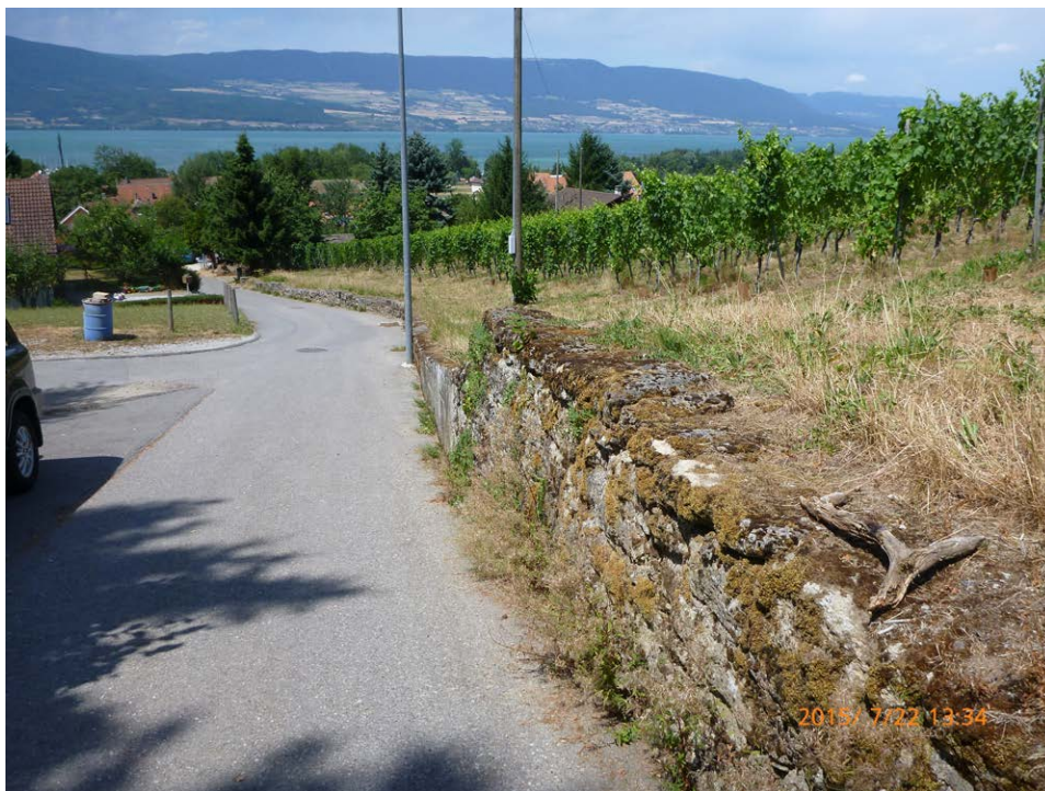
Photos de l'objet 22.07.2015